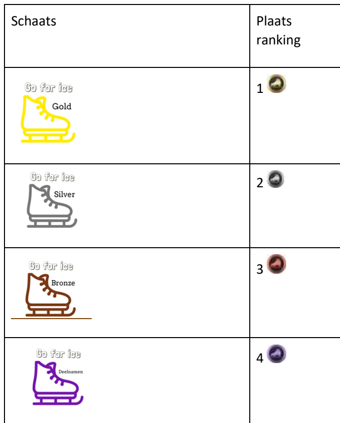
Tabel 3: Ranking mogelijkheden per pijler